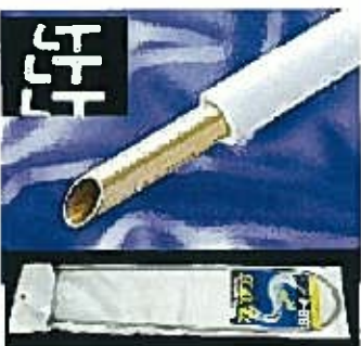
被覆銅管(給湯・給水)