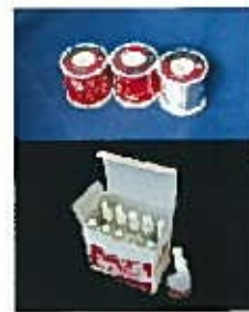
ソルダーフラックス