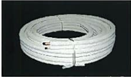
被覆銅管(空調コイル)