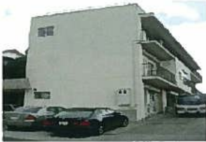
(株)チヨダ・千代田産業(株)本社

住宅・ビル・工場等の給湯・給水・空調用の保温付配管材及び配管用保温材の製造及び販売(関連部材)がビジネスです。