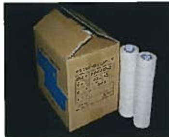
モルコカバー専用テープ