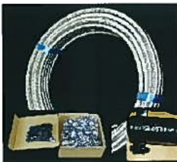
ステンレスフレキチューブ