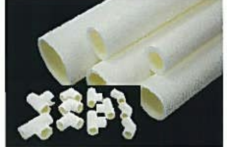
EPEチューブ(ドレン配管用)