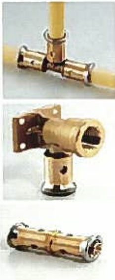
シーロックジョイント