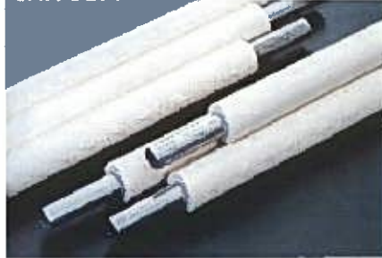
被覆ステンレス管&モルコカバー